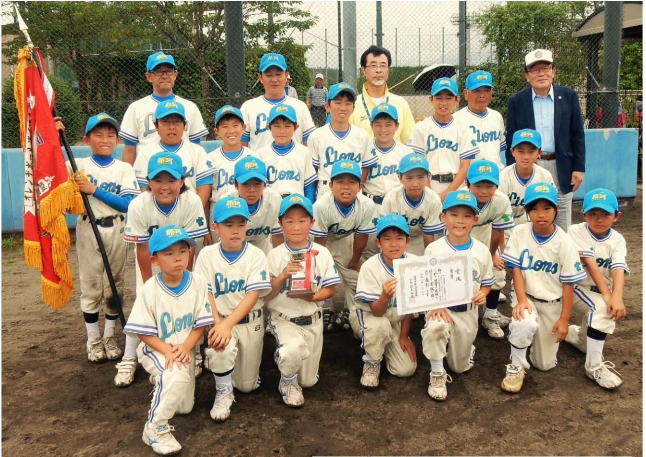
優勝した那珂ライオンズ