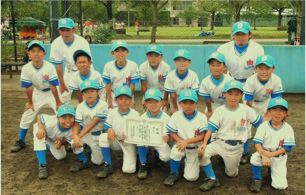
3位の南郷少年野球クラブ