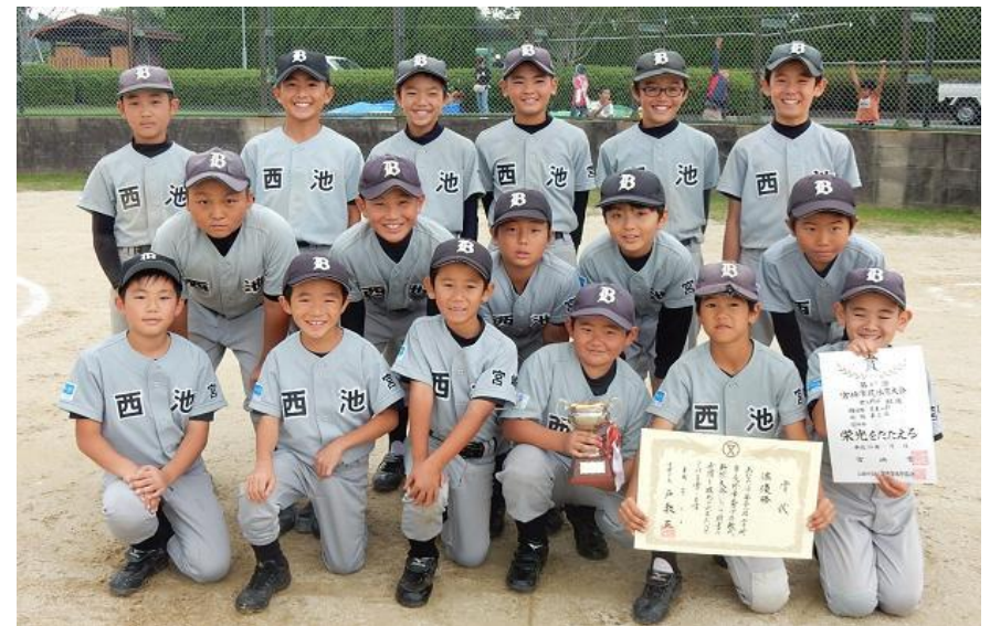
準優勝の西池ブルドッグ