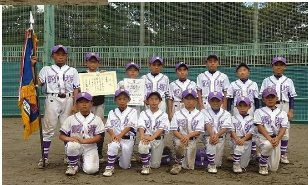
準優勝の鰐塚ジャイアンツ