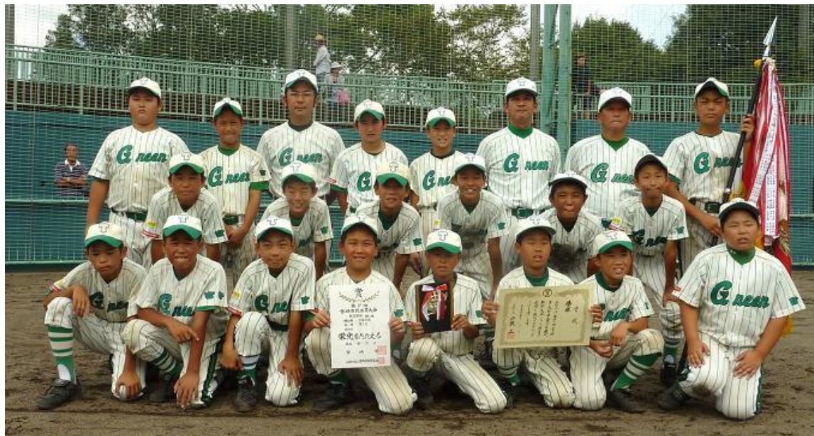
優勝した恒久グリーンナイン