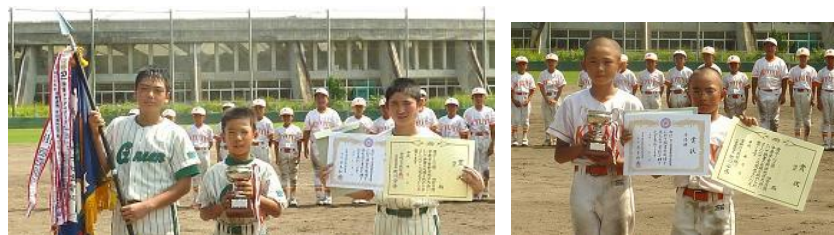
準優勝の宮崎球友