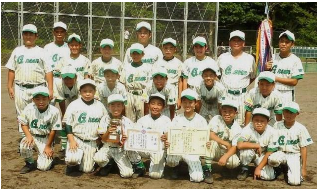
優勝した恒久グリーンナイン