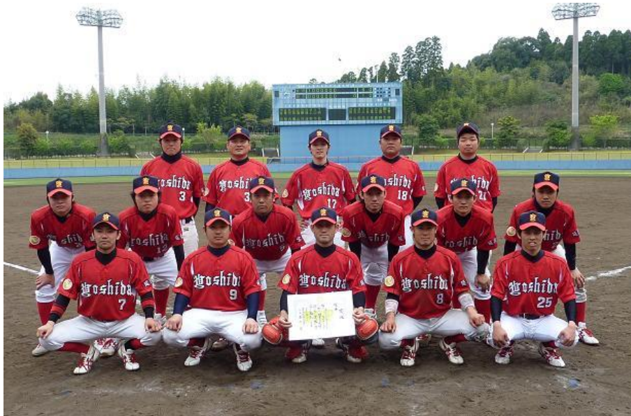
優勝した吉田病院